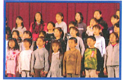
全校合唱「ピリープ」他