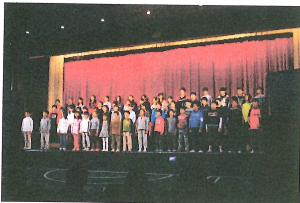
学芸会 全校合唱「ビリーブ」