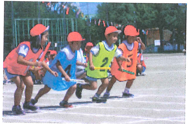
運動会で楽しく演技をしました。