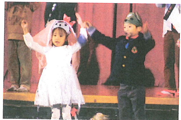
学芸会 1年生「ねずみの嫁入り」