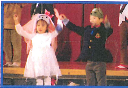
低学年「ねずみの嫁入り」