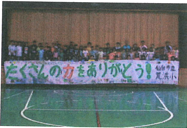
みんなでお礼の横断幕を作りました。